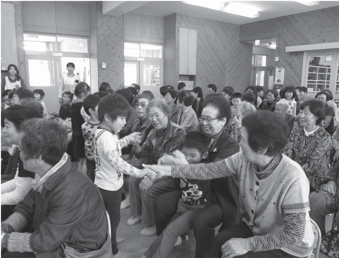
10月20日 大井田保育園との交流会(全体サロン) 参加者79名