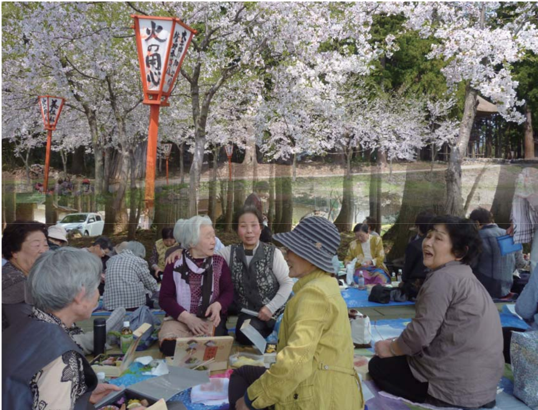
満開の大井田の郷公園での花見風景(4月28日 撮影)