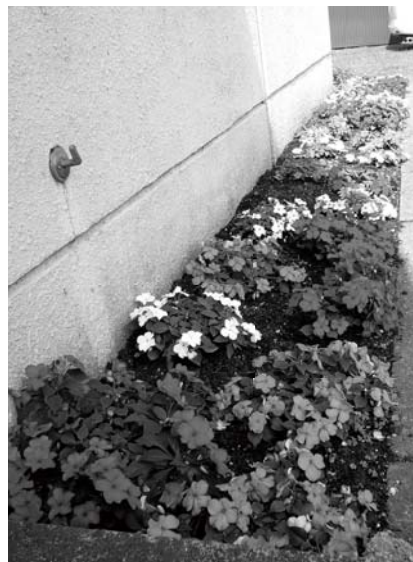
コミュニティセンターの花壇に綺麗な花が咲きました。