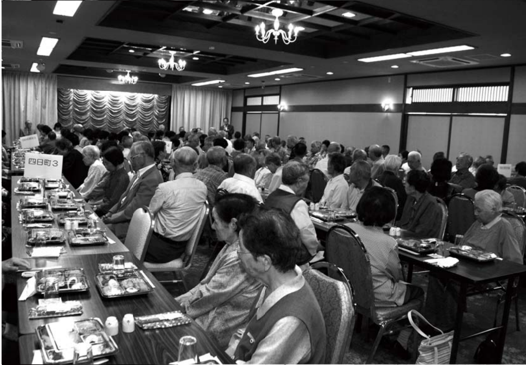
「しゃらく」様による演奏と歌