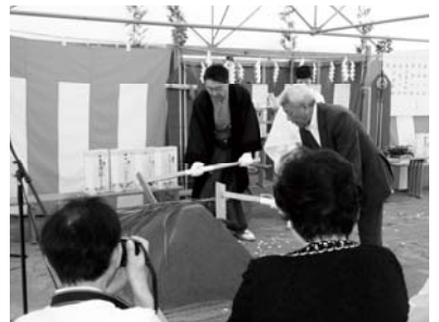
6月25日 消防署起工式