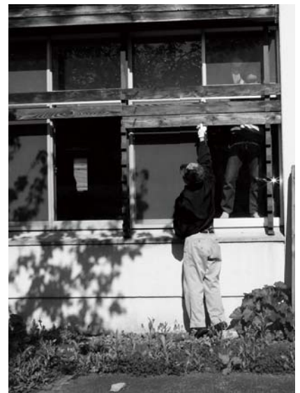
5月11日 コミュニティセンターの春季大清掃