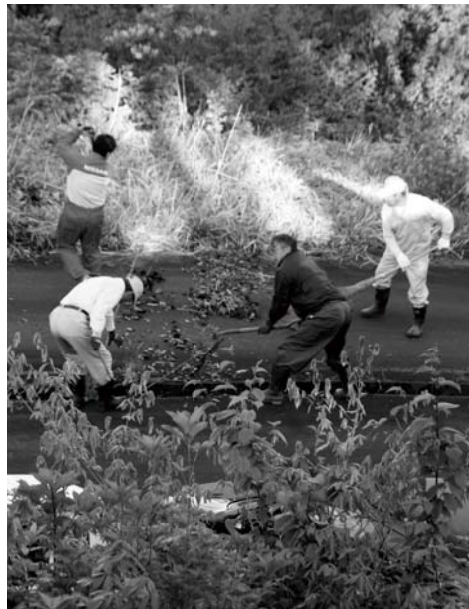
6月29日 権現堂草刈り