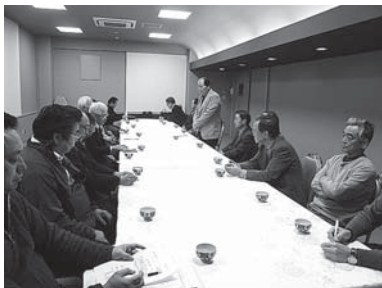
1月18日 施設活用委員会