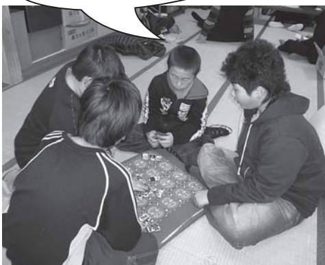
「花ガルトも楽しいね」

将棋については、来年は事前に申し込みを頂き、上級、初心者、少年の部を区分けをして、もっと大勢の皆様から参加して頂きたいと思っております。