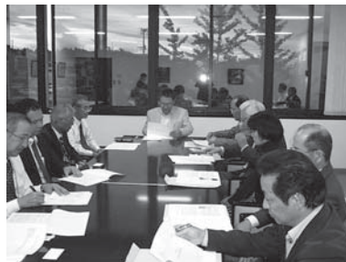
10月24日 市へ要望書提出