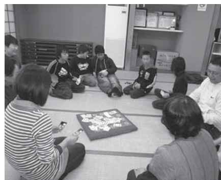
「トランプもやりました」

ぼうずめくりを初めてやったけど、姫が二回も出てうれしかったです。ごらく大会も始めて来て、今度弟とも一緒に来たいです。