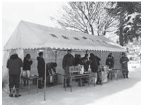
南新田町1・2・3 西公園