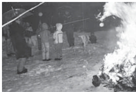
四日町・中原 大井田コミュニティ広場