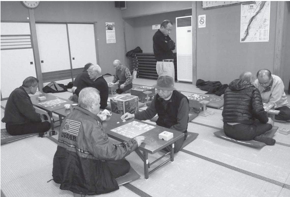
2月2日 新春娯楽大会 「今年こそ負けないぞ~!!」 参加者36名