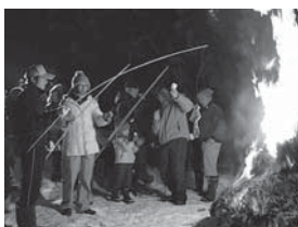
五軒新田 五社神社