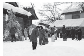
四日町新田 十二社