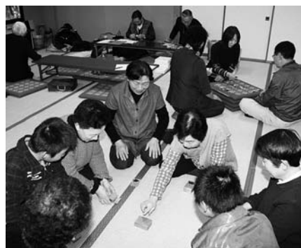
「坊主めくりも楽しかったね」