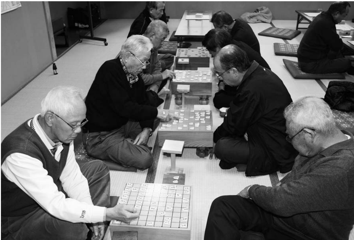
2月3日 新春娯楽大会 「う〜ん、手ごわいなあ〜」 参加者30名